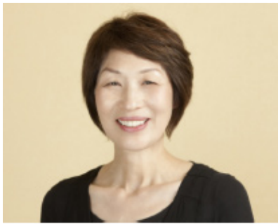
＜料理研究家 浜内千波＞